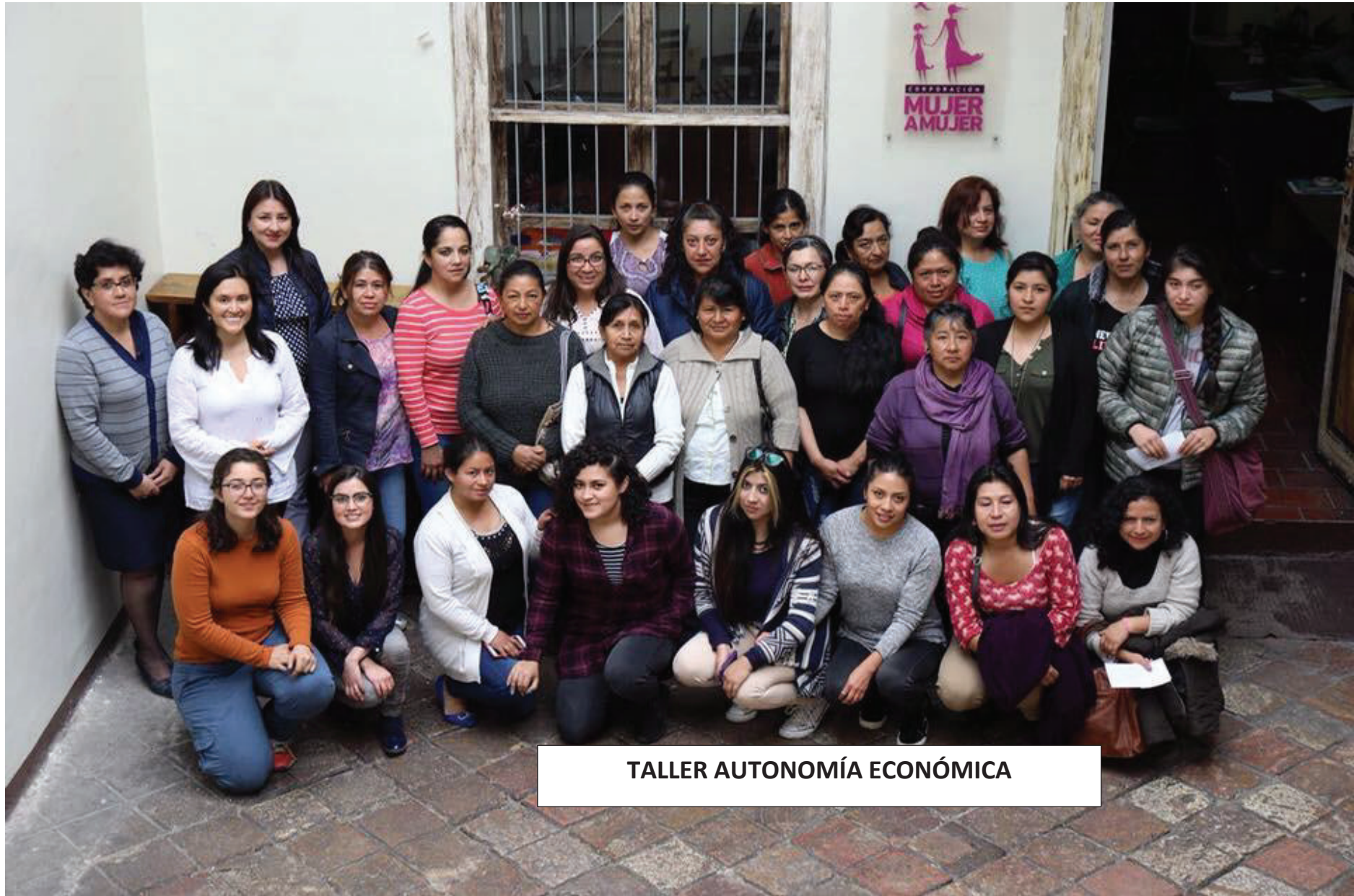
TALLER AUTONOMÍA ECONÓMICA