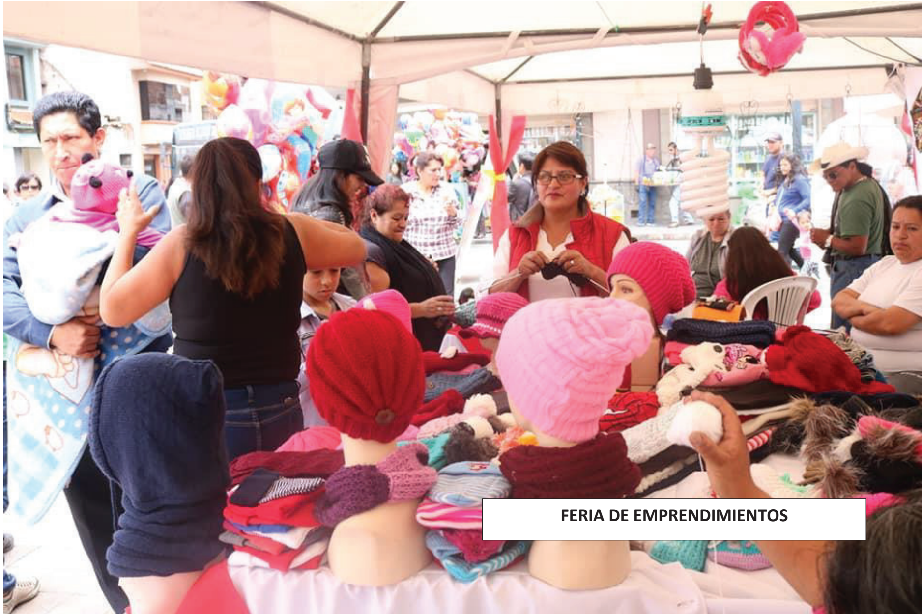
FERIA DE EMPRENDIMIENTOS